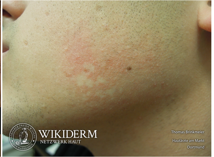
Naevus anaemicus, Wange