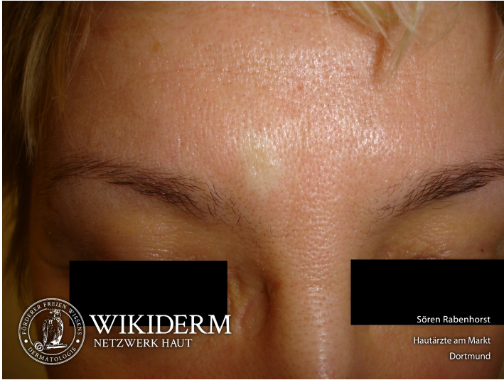
Naevus anaemicus, Glabella